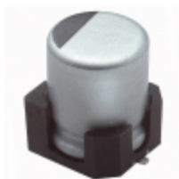
MZA10VC471MH10TP United Chemi-Con CAP ALUM 470UF 20% 10V SMD