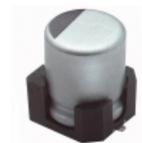
MZA10VC331MH10TP United Chemi-Con CAP ALUM 330UF 20% 10V SMD