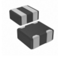
MZA1210D121C TDK Corporation FERRITE BEAD 120 OHM 0504 2LN