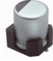
MZA10VC221MF80TP United Chemi-Con CAP ALUM 220UF 20% 10V SMD