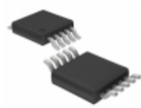
LTC4252A-2CMS#PBF Linear Technology IC CNTRLR HOTSWAP NEG VOLT 10MSOP