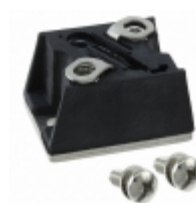
VS-T85HF120 Electro-Films (EFI) / Vishay DIODE GEN PURP 200V 85A D-55