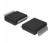
74HC4015DB,112 NXP USA Inc. IC DUAL 4BIT SHIFT REGIST 16SSOP