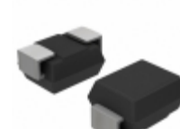
1SMB5924BT3G ON Semiconductor DIODE ZENER 9.1V 3W SMB