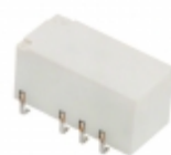
G6SK-2G DC3 Omron Electronics Inc-EMC Div RELAY TELECOM DPDT 2A 3V