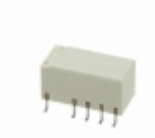
G6SK-2FDC2 Omron Electronics Inc-EMC Div RELAY TELECOM DPDT 2A 2V