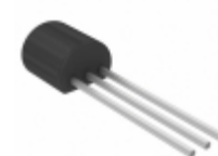
MCP1702-5002E/TO Microchip Technology IC REG LDO 5V 0.25A TO92-3