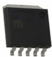
MIC37151-1.8BR Microchip Technology IC REG LDO 1.8V 1.5A SPAK-5