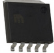
MIC37151-1.65WR-TR Microchip Technology IC REG LDO 1.65V 1.5A SPAK-5