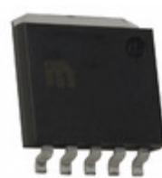
MIC37151-1.5BR Microchip Technology IC REG LDO 1.5V 1.5A SPAK-5