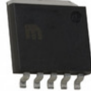
MIC37151-1.65WR Microchip Technology IC REG LDO 1.65V 1.5A SPAK-5