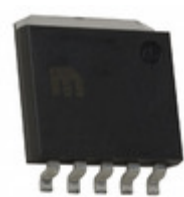
MIC37151-1.65BR Microchip Technology IC REG LDO 1.65V 1.5A SPAK-5