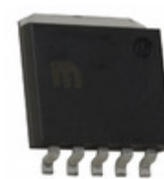
MIC37151-1.5WR Microchip Technology IC REG LDO 1.5V 1.5A SPAK-5