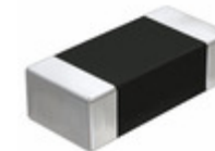
LMK107B7105MA-T Taiyo Yuden CAP CER 1UF 10V X7R 0603