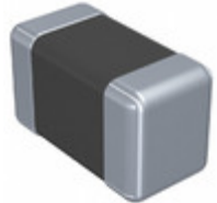
LMK107AC6475KA-T Taiyo Yuden CAP CER 4.7UF 10V X6S 0603