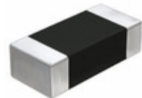
LMK107B7105KA-T Taiyo Yuden CAP CER 1UF 10V X7R 0603