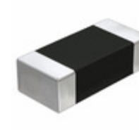
LMK107B7105KAHT Taiyo Yuden CAP CER 1UF 10V X7R 0603