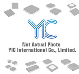
LTC1422I LT LT SOP8