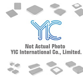
LTC1422IS8 Linter LTC1422IS8 Linter