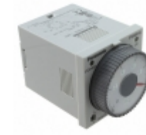
PM4HA-H-24V Panasonic RELAY TIME DELAY 500HR 5A 250V