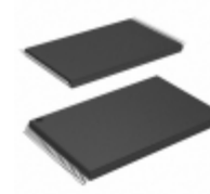
SST39LF200A-55-4C-EKE Microchip Technology IC FLASH 2MBIT 55NS 48TSOP