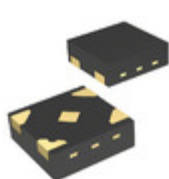
74LVC1G02FS3-7 Diodes Incorporated IC GATE NOR 2INP X2DFN-4