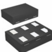
74LVC1G02FZ4-7 Diodes Incorporated IC GATE NOR 1CH 2-INP 6-DFN