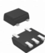
74LVC1G00Z-7 Diodes Incorporated IC GATE NAND 1CH 2-INP SOT-553