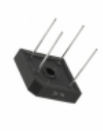
GBPC12005W Fairchild/ON Semiconductor RECT BRIDGE GPP 12A 50V GBPC-W