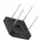
GBPC12005W AMI Semiconductor / ON Semiconductor RECT BRIDGE GPP 12A 50V GBPC-W