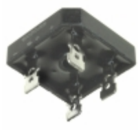
GBPC12005-E4/51 Electro-Films (EFI) / Vishay RECTIFIER BRIDGE 12A 50V GBPC