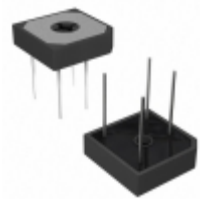
GBPC12005W-E4/51 Vishay Semiconductor Diodes Division DIODE 1PH 12A 50V GBPC-W