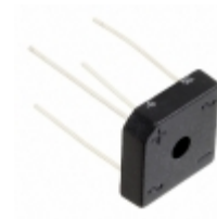
GBPC110-E4/51 Electro-Films (EFI) / Vishay DIODE GPP 1PH 3A 1000V GBPC1