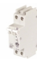
C1A2P American Electrical Inc. CIR BRKR MAG-HYDR 1A 480VAC