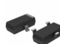
MA3Z79200L Panasonic Electronic Components DIODE SCHOTTKY 30V 100MA SMINI3