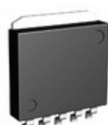
BA33DD0WHFP-TR Rohm Semiconductor IC REG LDO 3.3V 2A HRP5