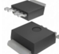
BA33C25FP-E2 Rohm Semiconductor IC REG LDO 3.3V/2.5V 1A TO252