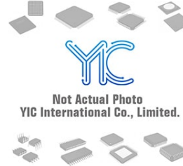
C1608C0G1H181JT TDK TDK SMD