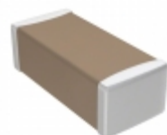
C1608C0G1H1R2C TDK Corporation CAP CER 1.2PF 50V C0G 0603