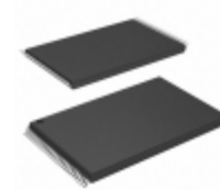
SST39VF3202-70-4I-EKE Microchip Technology IC FLASH 32MBIT 70NS 48TSOP