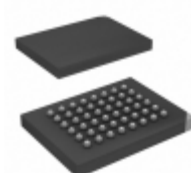
SST39VF3201C-70-4I-B3KE-T Microchip Technology IC FLASH 32MBIT 70NS 48TFBGA