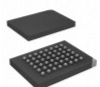
SST39VF3202-70-4I-B3KE-T Microchip Technology IC FLASH 32MBIT 70NS 48TFBGA