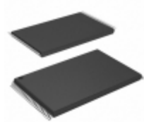
SST39VF3202-70-4C-EKE Microchip Technology IC FLASH 32MBIT 70NS 48TSOP