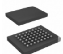
SST39VF3202-70-4C-B3KE Microchip Technology IC FLASH 32MBIT 70NS 48TFBGA