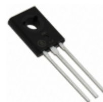
MJE344G ON Semiconductor TRANS NPN 200V 0.5A TO225AA