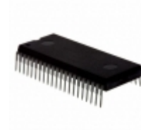
MC68HC908AP16CB NXP USA Inc. IC MCU 8BIT 16KB FLASH 42PSDIP