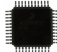
MC68HC908AP16CFB NXP USA Inc. IC MCU 8BIT 16KB FLASH 44QFP