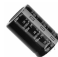
ECE-S1EG223Z Panasonic Electronic Components CAP ALUM 22000UF 20% 25V SNAP