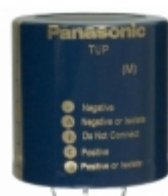
ECE-P2WP821HA Panasonic Electronic Components CAP ALUM 820UF 20% 450V SNAP