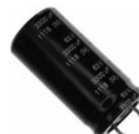
ECE-S1JG332N Panasonic Electronic Components CAP ALUM 3300UF 20% 63V SNAP