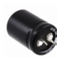
ECE-S1CG472E Panasonic Electronic Components CAP ALUM 47000UF 20% 16V SNAP