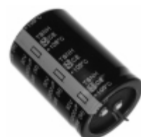
ECE-S1HG103Z Panasonic Electronic Components CAP ALUM 10000UF 20% 50V SNAP