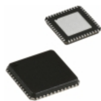
CY8CLED08-48LFXI Cypress Semiconductor Corp IC MCU 8BIT 16KB FLASH 48QFN