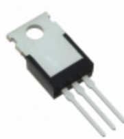
IXFP14N85X IXYS MOSFET N-CH 850V 14A TO220-3