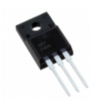
IXFP14N85XM IXYS MOSFET N-CH 8500V 14A TO220