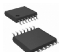
MIC2551YTS Microchip Technology IC USB TRANSCEIVER 14-TSSOP