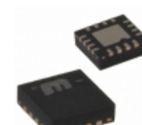
MIC2551YML-TR Microchip Technology IC USB TRANSCEIVER 16-MLF