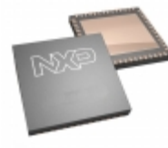
TJA1102SHN/OZ NXP Semiconductors / Freescale PHY ETHERNET