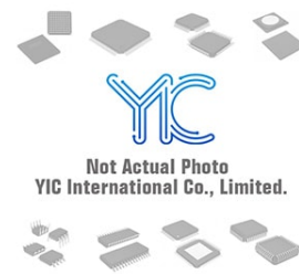
MC74VHCT50AG ON ON SOP14