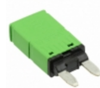
1620-2-15A E-T-A CIR BRKR THRM 15A 12VDC