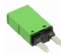
1620-2-30A E-T-A CIR BRKR THRM 30A 12VDC