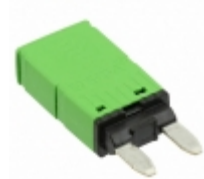
1620-2-20A E-T-A CIR BRKR THRM 20A 12VDC