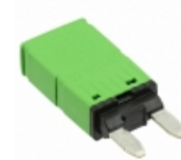
1620-2-5A E-T-A CIRCUIT BREAKER THRM 5A 12VDC