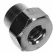
1620-2 Keystone Electronics Corp. HEX STANDOFF #6-32 BRASS 1/8"