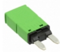
1620-2-10A E-T-A CIR BRKR THRM 10A 12VDC