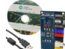
DS3231MZEVKIT# Maxim Integrated BOARD EVAL RTC FOR DS3231M