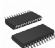
ICL3217EIB Intersil IC TXRX RS-232 3-5.5V ESD 24SOIC