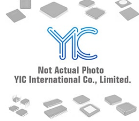
XC6220B321MR-G TOREX XC6220B321MR-G TOREX