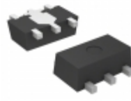
XC6220B281PR-G Torex Semiconductor Ltd IC REG LDO 2.8V 1A SOT89-5