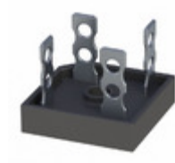
GBPC5008M T0G TSC (Taiwan Semiconductor) BRIDGE RECT 1P 800V 50A GBPC40-M