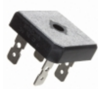
GBPC5006-G Comchip Technology RECT BRIDGE GPP 600V 50A GBPC