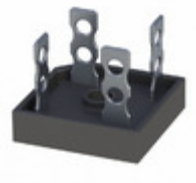
GBPC5006M T0G TSC (Taiwan Semiconductor) BRIDGE RECT 1P 600V 50A GBPC40-M