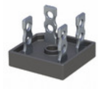
GBPC5006 T0G TSC (Taiwan Semiconductor) BRIDGE RECT 1P 600V 50A GBPC40