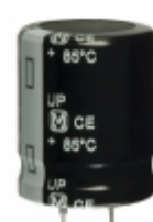
ECO-S1CP153CA Panasonic Electronic Components CAP ALUM 15000UF 20% 16V SNAP