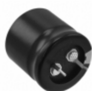
ECO-S1CP123CA Panasonic Electronic Components CAP ALUM 12000UF 20% 16V SNAP