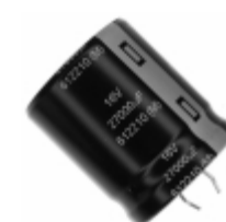
ECO-S1CP273DA Panasonic Electronic Components CAP ALUM 27000UF 20% 16V SNAP