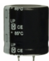
ECO-S1CP223DA Panasonic Electronic Components CAP ALUM 22000UF 20% 16V SNAP