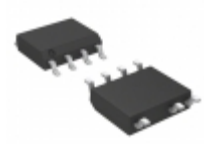
HFC0500GS-Z MPS (Monolithic Power Systems) FIXED FREQUENCY FLYBACK CONTROLL