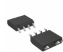
HFC0500GS MPS (Monolithic Power Systems) FIXED FREQUENCY FLYBACK CONTROLL