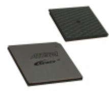
EP2S130F1508C5N Altera IC FPGA 1126 I/O 1508FBGA