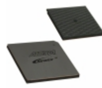
EP2S130F1508C3N Altera IC FPGA 1126 I/O 1508FBGA