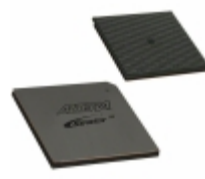
EP2S130F1508C4N Altera IC FPGA 1126 I/O 1508FBGA