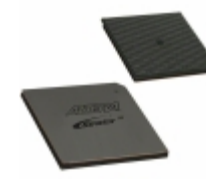
EP2S130F1508C5 Altera IC FPGA 1126 I/O 1508FBGA