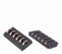
70ADJ-6-ML0 Bourns Inc. CONN MOD 6POS MALE SMD