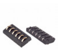
70ADJ-6-ML1 Bourns Inc. CONN MOD 6POS MALE SMD LOC PIN