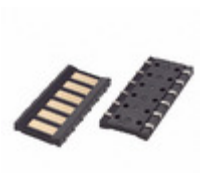
70ADJ-6-FLOG Bourns Inc. MODULAR CONTACT SMD FEMALE