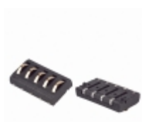
70ADJ-5-ML1 Bourns Inc. CONN MOD 5POS MALE SMD LOC PIN