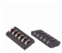
70ADJ-6-MLOG Bourns Inc. MODULAR CONTACT SMD MALE