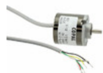
RE30E-600-213-1 Copal Electronics Inc. ROTARY ENCODER OPTICAL 600PPR