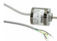
RE30E-900-213-1 Copal Electronics Inc. ROTARY ENCODER OPTICAL 900PPR