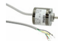
RE30E-800-213-1 Copal Electronics Inc. ROTARY ENCODER OPTICAL 800PPR