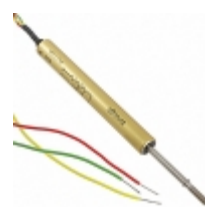
RE38L2C502 Vishay Spectrol POT 5000 OHM WW