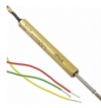
RE38L2C502 Electro-Films (EFI) / Vishay SENSOR LINEAR 50MM WIRE LEADS