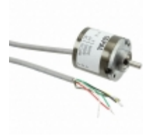
RE30E-500-213-1 Copal Electronics Inc. ROTARY ENCODER OPTICAL 500PPR