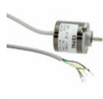
RE30E-360-213-1 Copal Electronics Inc. ROTARY ENCODER OPTICAL 360PPR