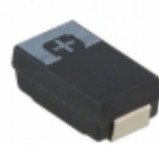
6TPF470MAH Panasonic Electronic Components CAP TANT POLY 470UF 6.3V 2917