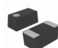
6TPH100MABC Panasonic Electronic Components CAP TANT POLY 100UF 6.3V 1206