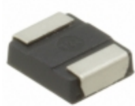
6TPG100MG Panasonic Electronic Components CAP TANT POLY 100UF 6.3V 1411