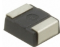
6TPG150MZG Panasonic Electronic Components CAP TANT POLY 150UF 6.3V 1411