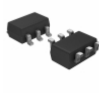
MIC5320-PGYD6-TR Microchip Technology IC REG LDO 3V/1.8V TSOT23-6