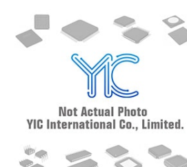
MIC5320-PGYD6 MIC MIC SOT23-6