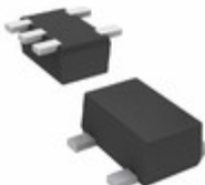
DMA502010R Panasonic Electronic Components TRANS 2PNP 50V 0.1A SMINI5