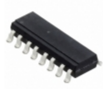
ACPL-844-300E Broadcom Limited OPTOISOLATOR 5KV 4CH TRANS 16SMD