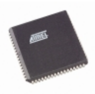
TS87C51RD2-MCL Microchip Technology IC MCU 8BIT 64KB OTP 68PLCC