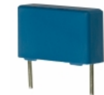
B32922C3683K289 EPCOS (TDK) CAP FILM 0.068UF 10% 305VAC RAD