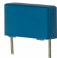
B32922C3683K EPCOS (TDK) CAP FILM 0.068UF 10% 305VAC RAD