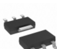
MCP1825S-2502E/DB Microchip Technology IC REG LDO 2.5V 0.5A SOT223-3