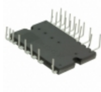
BM63764S-VC Rohm Semiconductor IC IPM 600V IGBT SW 25HSDIP