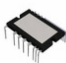
BM63767S-VC LAPIS Semiconductor 600V IGBT INTELLIGENT POWER MODU