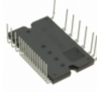
BM63763S-VC Rohm Semiconductor IC IPM 600V IGBT SW 25HSDIP