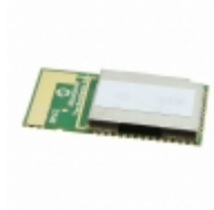
BM62SPKS1MC2-0001AA Microchip Technology RF TXRX MOD BLUETOOTH TRACE ANT