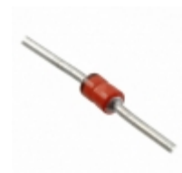
MAP4KE33AE3 Microsemi Corporation TVS DIODE 28.2VWM 45.7VC DO41