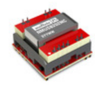
NMUSB202MC-R7 Murata Power Solutions Inc. DGTL ISO 3K 2CH USB MODULE