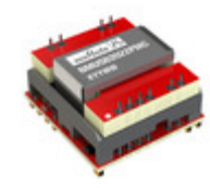
NMUSB2022PMC-R7 Murata Power Solutions POWERED DUAL PORT USB DATA ISOLA