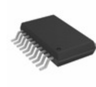
ADUM7643ARQZ-RL7 Analog Devices Inc. DGTL ISO 1KV 6CH GEN PURP 20QSOP