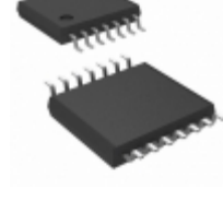
AD8574ARU Analog Devices Inc. IC OPAMP CHOPPER 1.5MHZ 14TSSOP