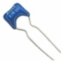
B37987M5104K000 EPCOS (TDK) CAP CER 0.1UF 50V X7R RADIAL