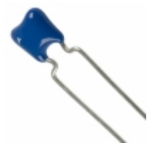
B37987M1683K000 EPCOS (TDK) CAP CER 0.068UF 100V X7R RADIAL