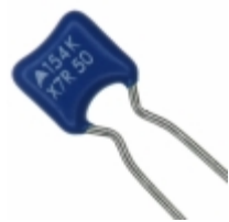
B37987M5154K051 EPCOS (TDK) CAP CER 0.15UF 50V X7R RADIAL