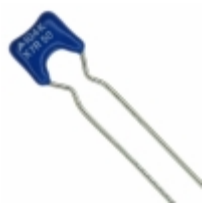
B37987M5104K051 EPCOS (TDK) CAP CER 0.1UF 50V X7R RADIAL