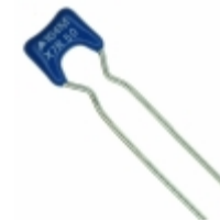
B37987M5104M051 EPCOS (TDK) CAP CER 0.1UF 50V X7R RADIAL