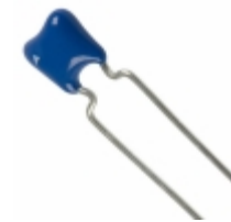
B37987M1473K054 EPCOS (TDK) CAP CER 0.047UF 100V X7R RADIAL