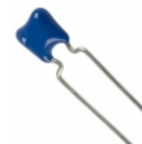
B37987M1683K054 EPCOS (TDK) CAP CER 0.068UF 100V X7R RADIAL