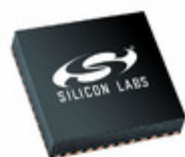
SI4685-A10-GMR Energy Micro (Silicon Labs) IC ANLG/DGTL RADIO 48QFN